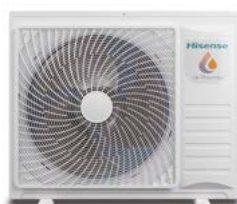
Bi Bloc 4,4/6/8 kW