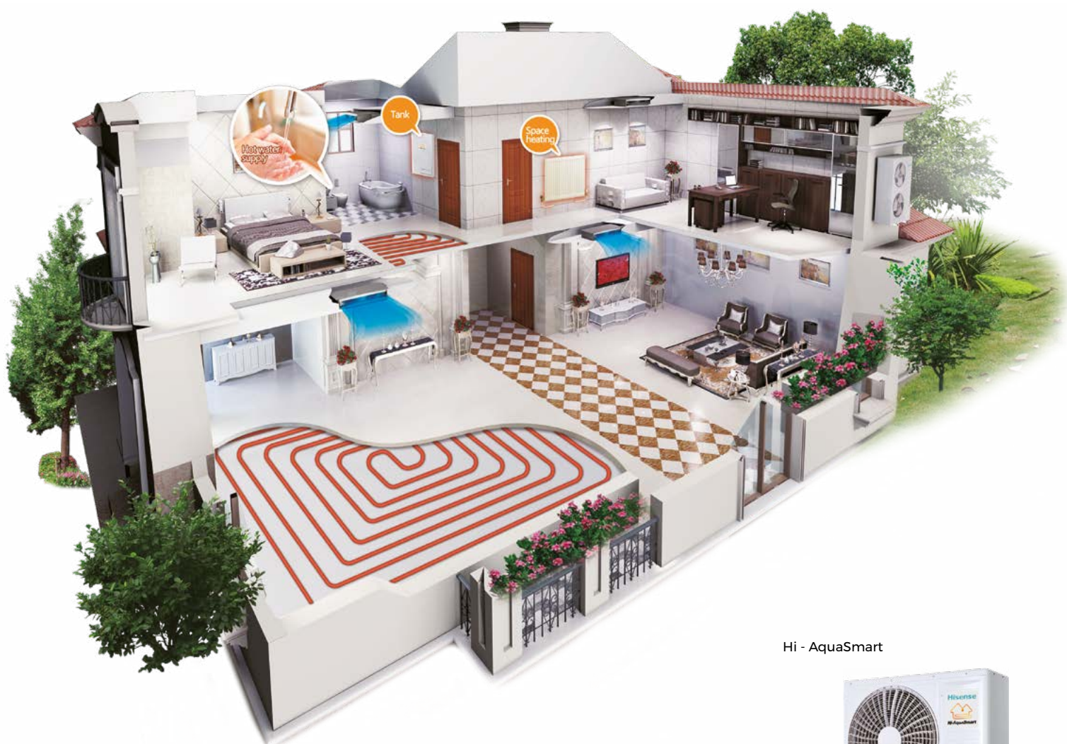
Hi - Therma R32

El sistema de bomba de calor aerotermia Hisense absorbe la energía gratis del ambiente exterior, que consume menos electricidad para generar más energía térmica. Las series Hi-AquaSmart y Hi-Therma R32 tienen un mejor rendimiento, alta eficiencia, un elevado ahorro de energía y producen menos emisiones de CO 2 . Estas series pueden ser fáciles de instalar en edificios nuevos o existentes. Las bombas de calor aerotermia Hisense de alta eficiencia obviamente pueden reducir el consumo de energía del edificio. Además, pueden funcionar con una fuente de calefacción tradicional, como una caldera de gas o gasoil.