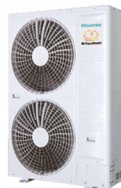
Bi Bloc 14/16 kW