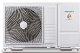
Monobloc 4,4/8 kW