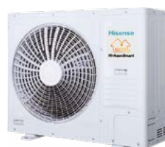
Bi Bloc 9/12 kW